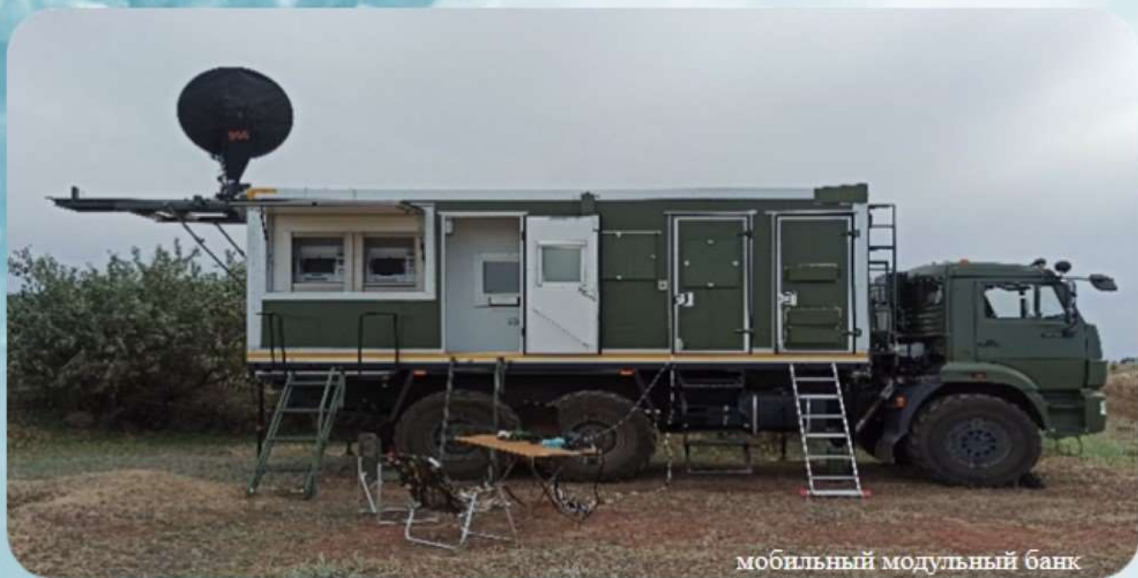
мобильный модульный банк